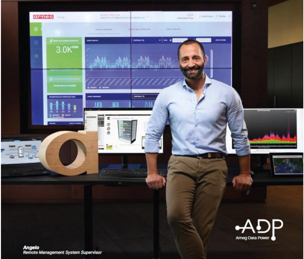
Angelo Remote Management System Supervisor

We take all the time we need to design a new service