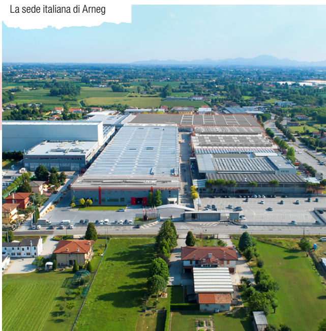
La sede italiana di Arneg

Arneg è strutturata con diversi brand che insieme garantiscono l'intero processo di realizzazione del punto di vendita . Un'anima che si declina nelle diverse risposte alle necessità dei clienti in tutto il mondo.