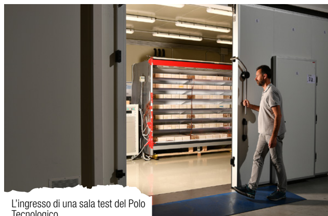
L'ingresso di una sala test del Polo Tecnologico

gettuale da un pool di architetti del Politecnico di Milano. Il nuovo complesso è costituito da due edifici: una villa storica di inizio '900 patrimonio delle Belle Arti, dedicata alle attività di ufficio e al laboratorio metrologico, e una struttura all'avanguardia, con il 35% di capacità di test in più