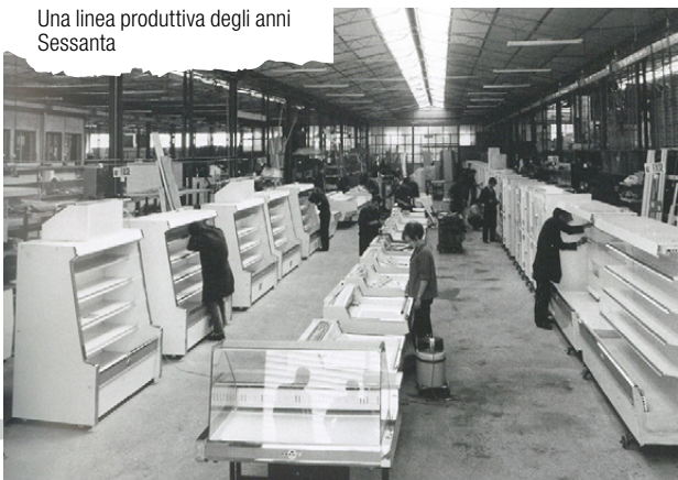
Una linea produttiva degli anni Sessanta

frigerate, tavole calde, mobili frigo verticali e semi-verticali multi ripiano, isole aperte e chiuse, murali orizzontali, impianti frigoriferi, mobili roll-in e retrobanchi - così da adattarsi a ogni esigenza del retail. Il fil rouge? Uno solo, che il mercato riconosce e la clientela cerca: la personalizzazione , grazie alla quale Arneg rispetta e valorizza l'identità di ogni business. Complesso? No, sfidante; soprattutto parte integrante di quella capacità di "saper sognare", tanto cara ai fondatori (come si vedrà tra poco).