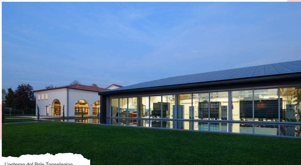
L'esterno del Polo Tecnologico

Il cuore dell'innovazione coltivata in Arneg è rappresentato dall' Area Ricerca e Sviluppo : qui nascono le idee che poi si traducono in soluzioni per il mercato e vengono coltivate relazioni con Università e Centri di Ricerca Internazionali . In stretta collaborazione con i clienti, i prodotti vengono letteralmente inventati; alle spalle la garanzia e l'affidabilità di una realtà industriale solida.