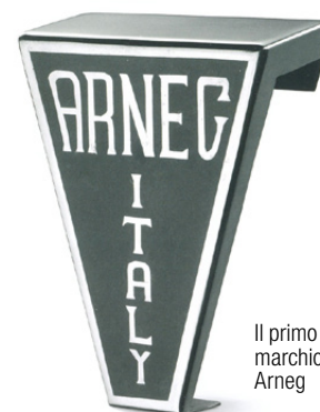
Il primo marchio Arneg

Anno dopo anno, prodotto dopo prodotto, queste parole restano il filo conduttore dell'espansione Arneg; a questo viene affiancato il Codice Etico, guidato dai principi di “Correttezza, Riservatezza, Collaborazione, Sostenibilità, Rispetto”.