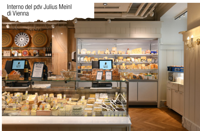
Interno del pdv Julius Meini di Vienna

L'azienda crede nel potere della ricerca e nel progresso continuo. I bisogni dei clienti vengono ascoltati e la rete internazionale contribuisce a condividere nuove prospettive, anticipando e cavalcando i trend di mercato.