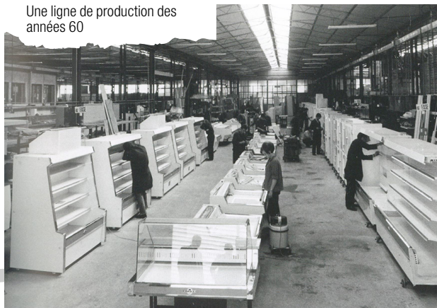
Une ligne de production des années 60

Le projet élargi d'Arneg concerne dès le départ l'ensemble de Busiago Vecchia (Campo San Martino, province de Padoue), le village dont sont originaires les deux fondateurs. Les premiers employés, le curé, les familles. Tout le monde est convaincu, avec clairvoyance, que cette entreprise a le potentiel pour grandir. Le climat qu'on y respire est toujours ainsi, presque familial: confiance réciproque, communication constante, relation directe avec les propriétaires. Un groupe de travail uni, concentré sur son objectif.