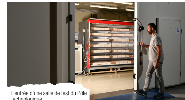
L'entrée d'une salle de test du Pôle technologique

Ce bâtiment consomme peu, il est partiellement autonome d'un point de vue énergétique et dispose d'un système de récupération de l'énergie produite par les cycles de test, dans une optique de développement durable.