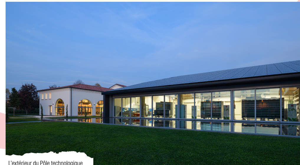
L'extérieur du Pôle technologique

Le cœur de l'innovation cultivée chez Arneg est représenté par la Division Recherche & Développement : ici naissent les idées qui se traduisent ensuite par des solutions pour le marché et ici sont cultivées les relations avec les universités et les centres de recherche internationaux. En étroite collaboration avec les clients, les produits sont littéralement inventés, en s'appuyant sur la garantie et la fiabilité d'une solide entreprise industrielle.