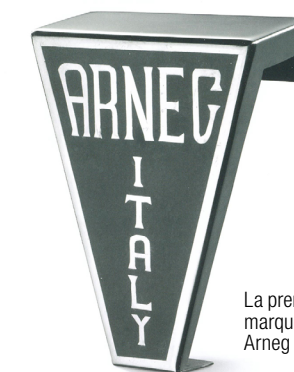
La première marque Arneg

Au fil des ans et des produits, ces mots restent le fil conducteur de l'expansion d'Arneg. À cela il faut ajouter le Code d'éthique basé sur les principes suivants : «Rectitude, Confidentialité, Collaboration, Développement durable et Respect».