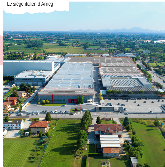
Le siège italien d'Arneg

Arneg est structurée avec plusieurs marques qui garantissent ensemble l'intégralité du processus de réalisation du point de vente. Une âme qui se décline dans les différentes réponses aux exigences des clients du monde entier.