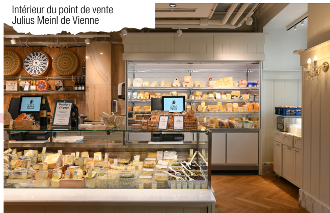
Intérieur du point de vente Julius Meinl de Vienne

C'est-à-dire la qualité, l'attention accordée au moins